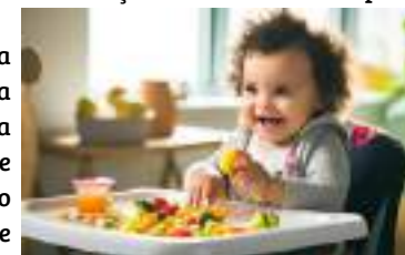
Imagem retirada de: Premium AllImage | a baby comfortably sitting in a high chair eagerly eating a colorful plate of mashed fruits and veg. (freepik.com)

Podemos concluir então que, além de contribuírem para uma dieta mais variada, inclusiva, que abre portas também a momentos de partilha de refeição sem restrições, a introdução de uma dieta variada em tipos de alimentos e consistências diferentes confirma que todas as etapas do desenvolvimento psicomotor oral estará a fazer-se harmoniosamente e traz grandes vantagens ao desenvolvimento da fala de forma adequada e correta.